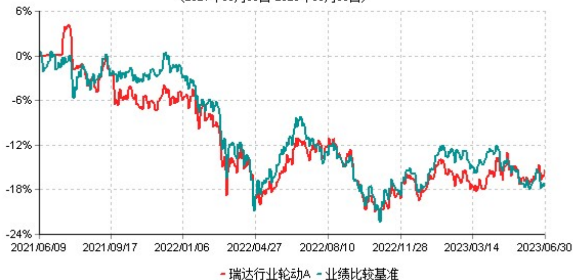
瑞达行业轮动A累计净值增长率与业绩比较基准收益率历史走势对比图 (2021年06月09日-2023年06月30日)