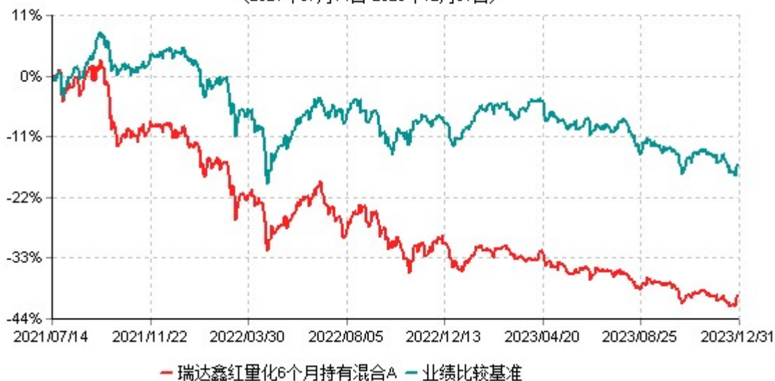
瑞达鑫红量化6个月持有混合A累计净值增长率与业绩比较基准收益率历史走势对比图 (2021年07月14日-2023年12月31日)