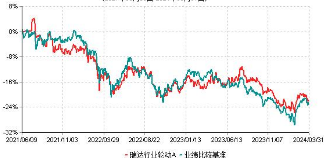
瑞达行业轮动A累计净值增长率与业绩比较基准收益率历史走势对比图 (2021年06月09日-2024年03月31日)