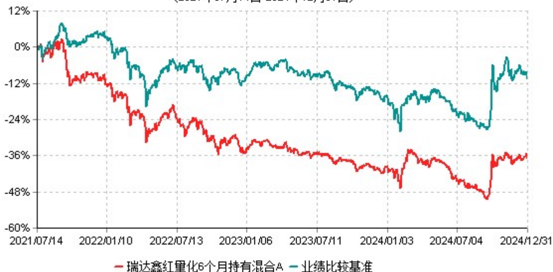
瑞达鑫红量化6个月持有混合A累计净值增长率与业绩比较基准收益率历史走势对比图 (2021年07月14日-2024年12月31日)